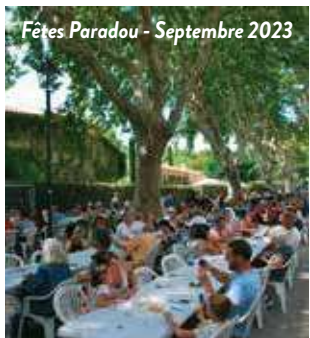
Fêtes Paradou - Septembre 2023