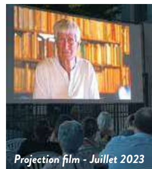
Projection film - Juillet 2023