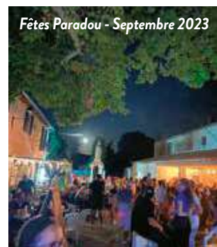
Fêtes Paradou - Septembre 2023