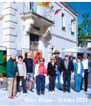
Rétro Escale - Octobre 2023