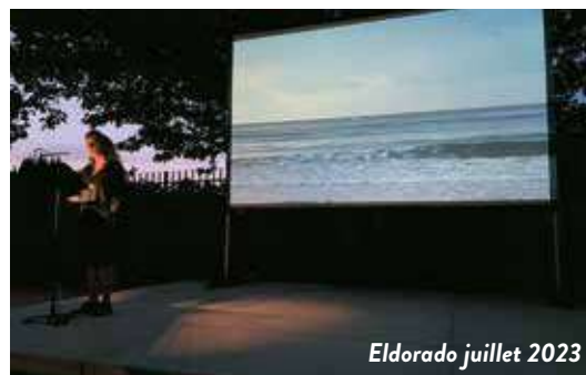
Eldorado juillet 2023