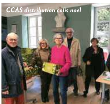
CCAS distribution colis Noël