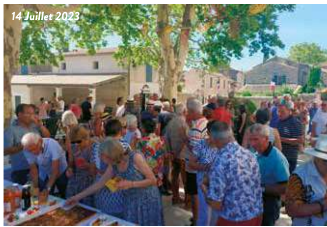
14 Juillet 2023