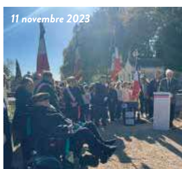
11 novembre 2023