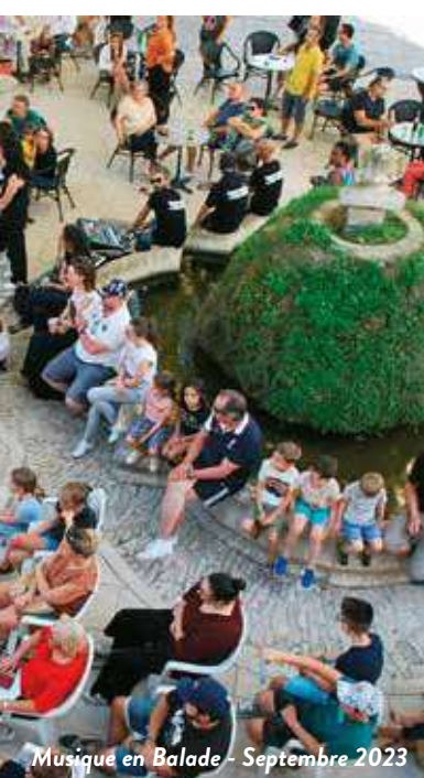
Musique en Balade - Septembre 2023