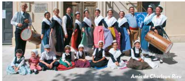
Amis de Charloum Rieu