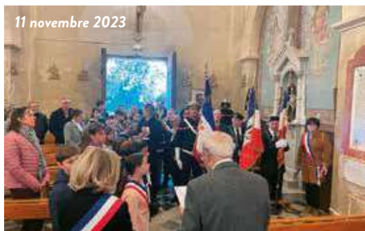
11 novembre 2023