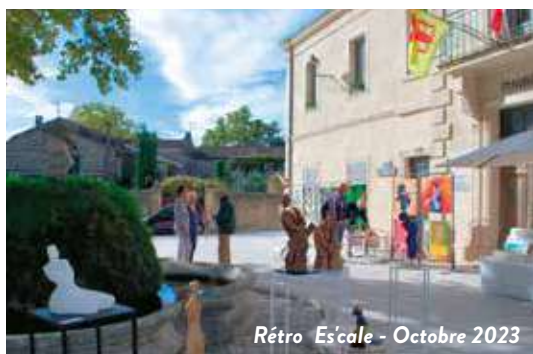
Rétro Escalé - Octobre 2023