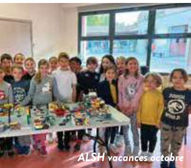
ALSH vacances octobre