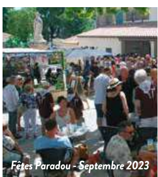
Fêtes Paradou - Septembre 2023