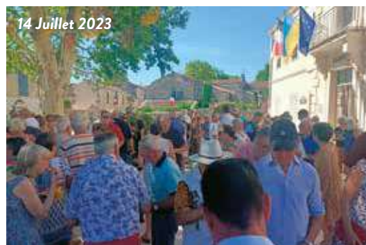
14 Juillet 2023