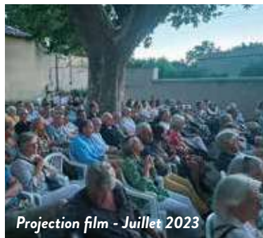
Projection film - Juillet 2023