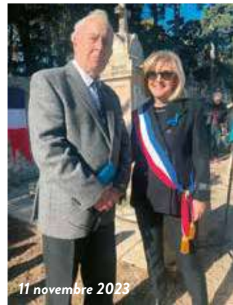
11 novembre 2023