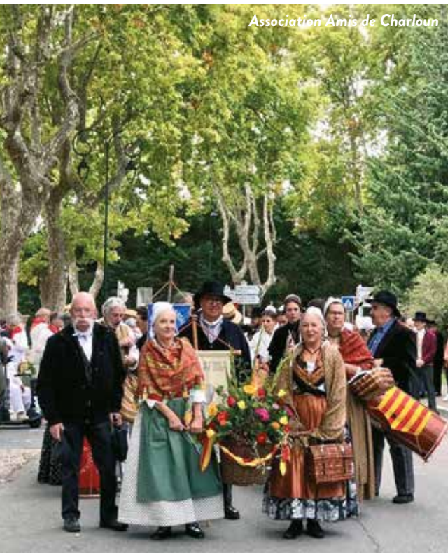
Association Amis de Charloum