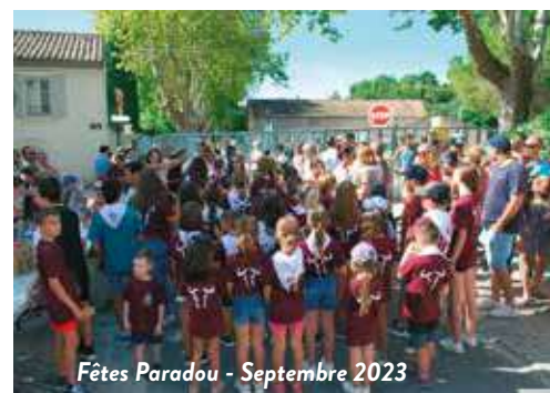
Fêtes Paradou - Septembre 2023