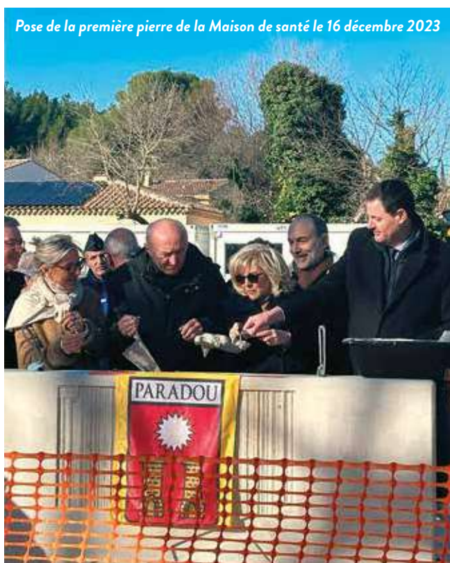
Pose de la première pierre de la Maison de santé le 16 décembre 2023

La salle polyvalente offrira, dès son ouverture au public, un hall d'accueil, une vaste salle principale, des locaux de rangement et un office, sans oublier la salle des associations. Le projet prévoit également le déplacement du poste de transformation ENEDIS de desserte électrique du village, qui sera intégré au bâtiment de la maison de santé.