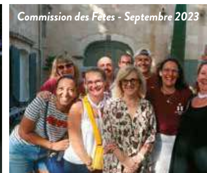
Commission des Fêtes - Septembre 2023