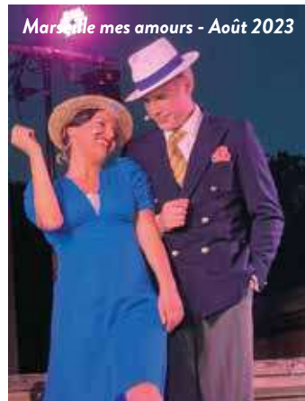
Marseille mes amours - Août 2023