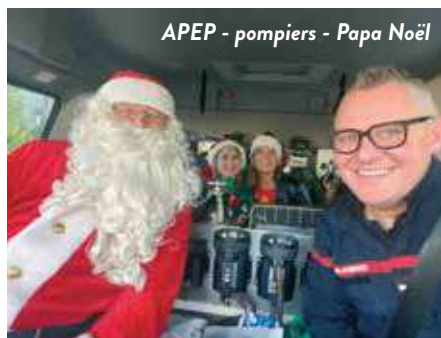
APEP - pompiers - Papa Noël