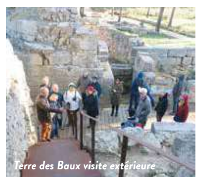
Terre des Baux visite extérieure