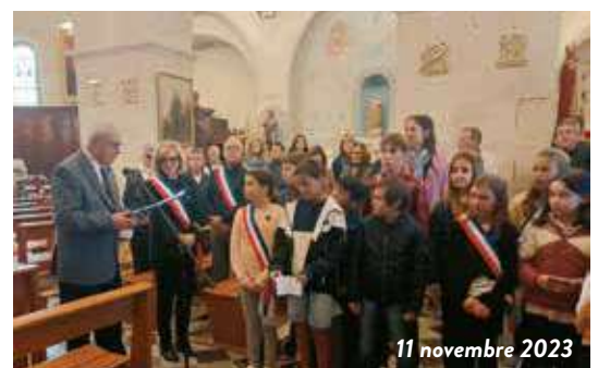
11 novembre 2023