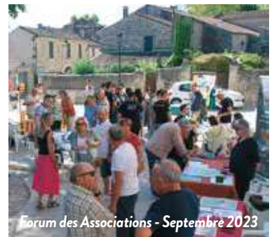
Forum des Associations - Septembre 2023