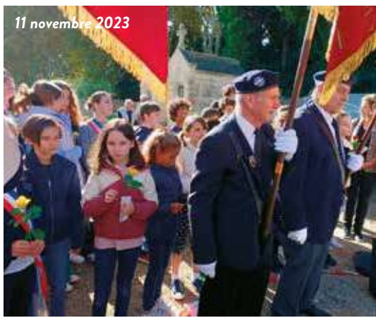
11 novembre 2023