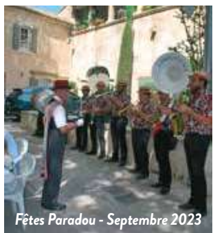
Fêtes Paradou - Septembre 2023